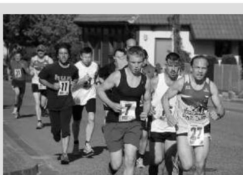
Závod Sloup - Petrovice