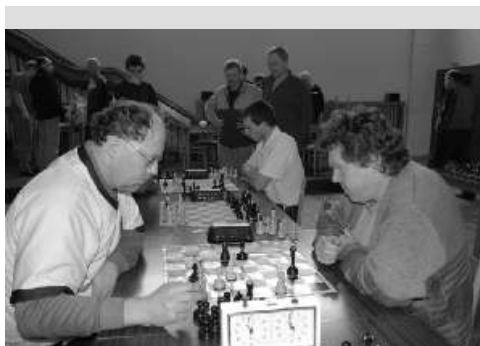
Okresní přebor v bleskové hře