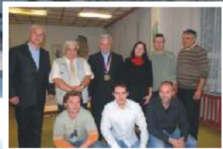
Zastupitelstvo má nové složení.