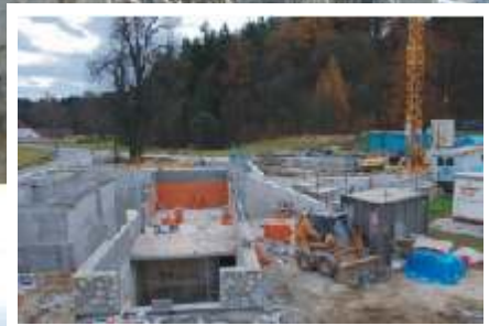
Práce na ČOV jsou v plném proudu.