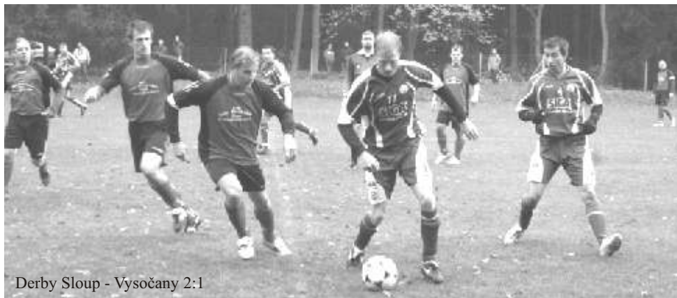
Derby Sloup - Vysočany 2:1

V závěru podzimu pak přišla na přestup z Aposu Blansko další významná posila několikanásobný nejlepší fotbalista okresu Blansko Tomáš Kleveta, který již chtěl s fotbalem skončit. Pak ale zjistil, že by se mu ještě moc stýskalo a dal se přesvědčit, že svoji kariéru (po vzoru svého otce) ukončí ve Sloupě. Na druhé straně brankář